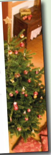
Diese drei Oberlieferungen zeigen uns die Werte der Weihnachten und erinnern uns an Nächstenliebe und die Schönheit der Schenken.