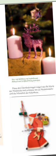
Der und blühen auf Apfelbaum Abend und Vorweihnachtszeit